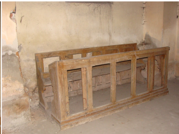
Ilustracja 40,41,42,43,44 i 45: zdjęcia autorstwa S. Bogusz, 2013r.