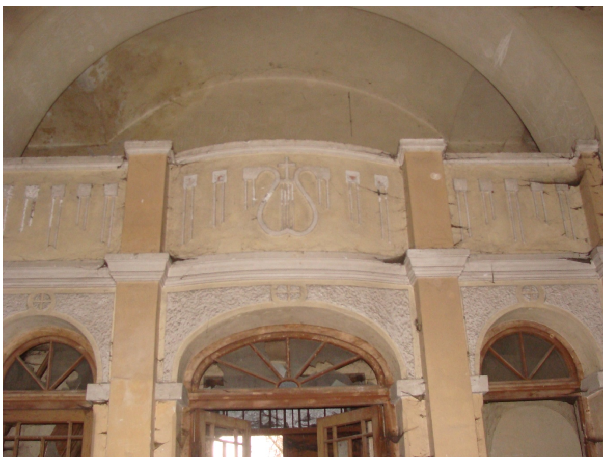
Ilustracja 38 i 39: zdjęcia autorstwa S. Bogusz, 2013r.