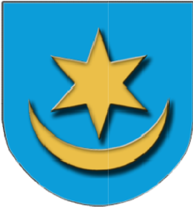
ilustracja 31: http://bip.ugkrzywcza.pl/?c=mdRejestr-cmPokaz-93-0-306