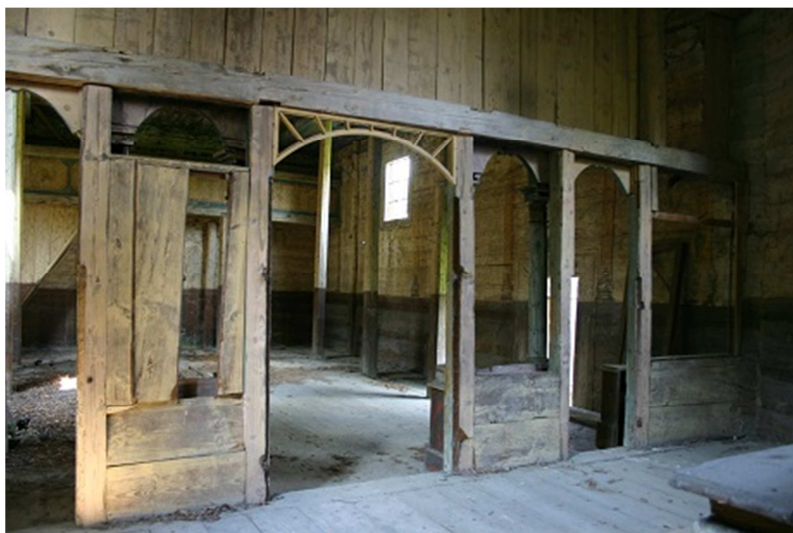
Fot. 5. Cerkiew greckokatolicka pw. Zaśnięcia Bogurodzicy w Babicach – rama ikonostasu z elementami snycerki (widok na odwrocie, czyli od strony sanktuarium) stanowiąca pozostałość pierwotnego wyposażenia świątyni (oraz pełniąca jednocześnie funkcję konstrukcyjną „ściany kurtynowej” wydzielającej sanktuarium od nawy)