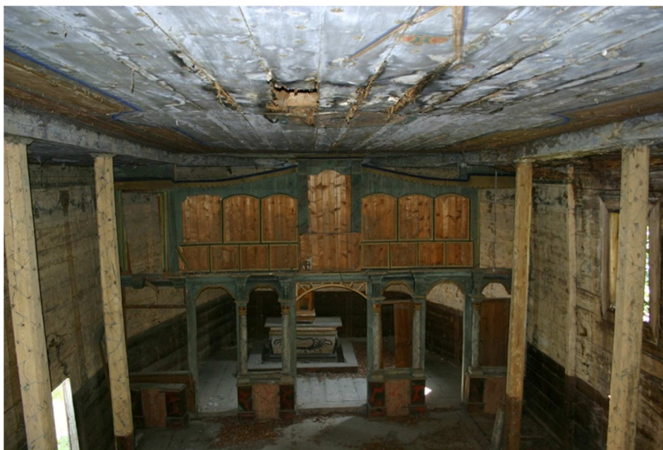
Fot. 3. Cerkiew greckokatolicka pw. Zaśnięcia Bogurodzicy w Babicach – pozbawiona ikon kurtynowa ściana ikonostasowa wydzielająca sanktuarium od nawy

Pierwotnie we wnętrzu cerkwi w Babicach znajdował się bogato zdobiony ikonostas, którego zasadnicza konstrukcja, w formie kurtynowej ściany z desek (rama ikonostasu), jednocześnie wydzielała sanktuarium z nietypowej, jednoprzestrzennej bryły budowli (fot. 3).