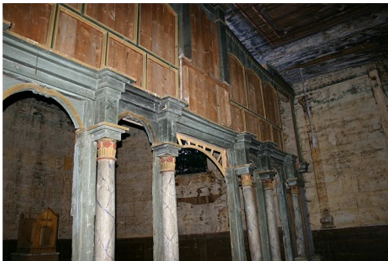
Fot. 4. Cerkiew greckokatolicka pw. Zaśnięcia Bogurodzicy w Babicach – rama ikonostasu z elementami snycerki (fragment) stanowiąca pozostałość pierwotnego wyposażenia świątyni (oraz pełniąca jednocześnie funkcję konstrukcyjną „ściany kurtynowej” wydzielającej sanktuarium od nawy)