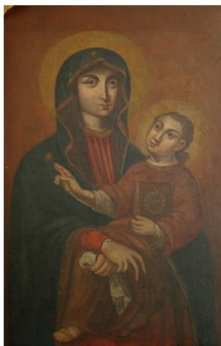
Fot. 8. Ikona Umilenie (numer ewidencyjny MZŁ-SZR-894)