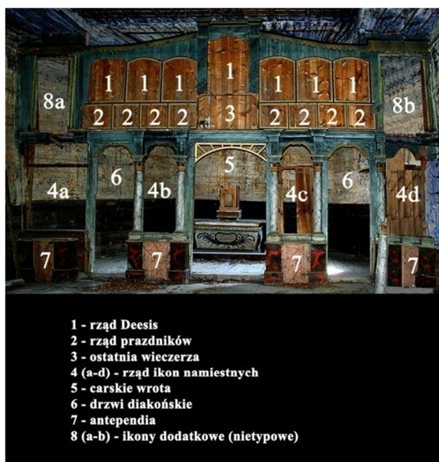
Ryc. 5. Układ formalny i ikonograficzny ikonostasu z Babic (schemat)