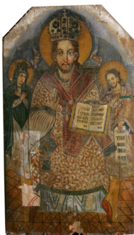
Fot. 11. Ikona Deesis (numer ewidencyjny MZŁ-SZR-895)