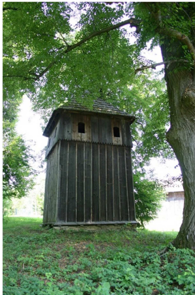
Fot. 2. Wolno stojąca drewniana dzwonnica nieopodal greckokatolickiej cerkwi pw. Zaśnięcia Bogurodzicy w Babicach

Nieopodal cerkwi i od jej strony zachodniej znajduje się wolno stojąca drewniana dzwonnica z 1840 r. [6], wykonana w konstrukcji szkieletowej (fot. 2).