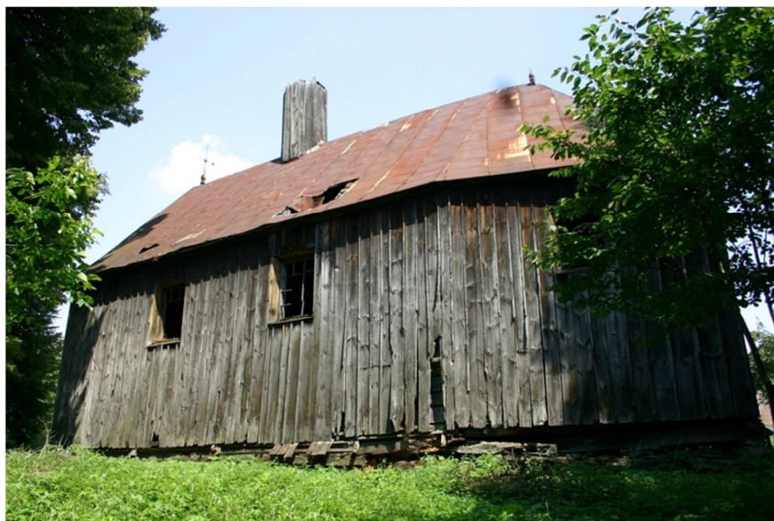
Fot. 1. Cerkiew greckokatolicka pw. Zaśnięcia Bogurodzicy w Babicach

Drewniana cerkiew greckokatolicka pw. Zaśnięcia Bogurodzicy w Babicach (gmina Krzywca) wzniesiona została w konstrukcji zrębowej i zlokalizowana jest na niewielkim wzniesieniu w południowo-zachodniej części miejscowości (fot. 1).