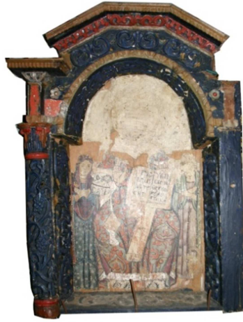
Fot. 6. Ikona Deesis (numer ewidencyjny MZŁ-SZR-889)