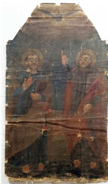
Fot. 12. Ikona Dwaj Apostołowie (św. Piotr i św. Paweł), (numer ewidencyjny MZŁ-SZR-896)