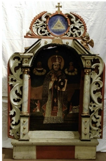
Fot. 7. Ikona św. Mikołaj (numer ewidencyjny MZŁ-SZR-890)