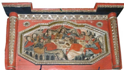
Fot. 14. Ikona Ostatnia Wieczerza (numer ewidencyjny MZŁ-SZR-898)