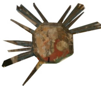
Fot. 15. Ikona-medalion Emmanuel (numer ewidencyjny MZŁ-SZR-899)