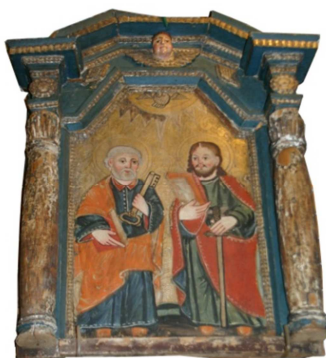
Fot. 13. Ikona Dwaj Apostołowie (św. Piotr i św. Paweł), (numer ewidencyjny MZŁ-SZR-897)