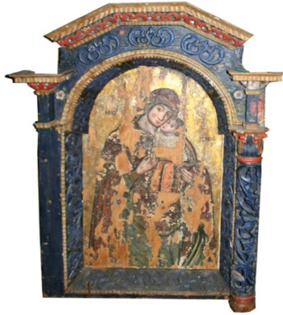
Fot. 9. Ikona Hodigitria (numer ewidencyjny MZŁ-SZR-893)