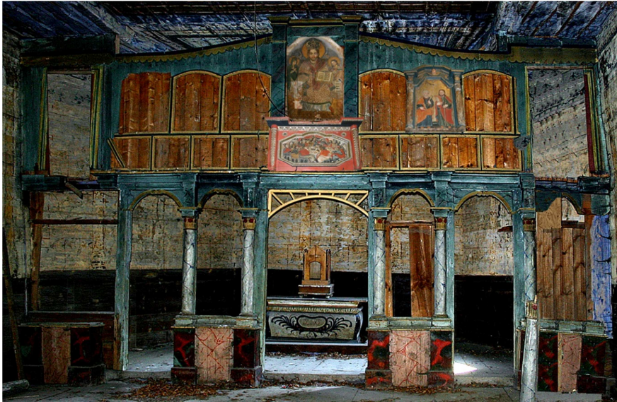
Ryc. 6. Rekonstrukcja prawdopodobnego pierwotnego rozmieszczenia zachowanych ikon w ramie ikonostasu (schemat)

Wstępne rozeznanie konserwatorskie pozwala założyć, iż przynajmniej trzy z zachowanych w Dziale Sztuki Cerkiewnej Muzeum-Zamku w Łańcucie ikon to elementy oryginalnego ikonostasu z babickiej cerkwi 14 . Ikonami tymi są: Ikona Deesis (numer ewidencyjny MZŁ-SZR-895) – stanowiąca centralny obraz rzędu Deesis, Ikona Dwaj Apostołowie (św. Piotr i św. Paweł) – przedstawiająca dwóch spośród dwunastu apostołów rzędu Deesis, oraz Ikona Ostatnia Wieczera (numer ewidencyjny MZŁ-SZR-898) – znajdująca się ponad carskimi wrotami. Ich prawdopodobne pierwotne rozmieszczenie zobrazowane jest na rycinie 6.