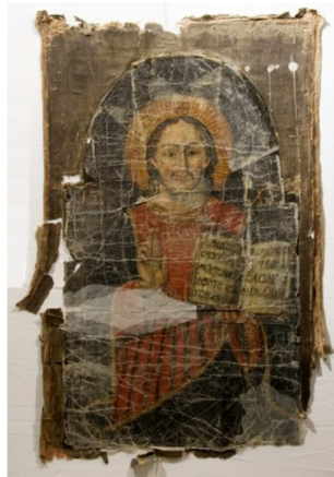
Fot. 10. Ikona Spas (numer ewidencyjny MZŁ-SZR-892)